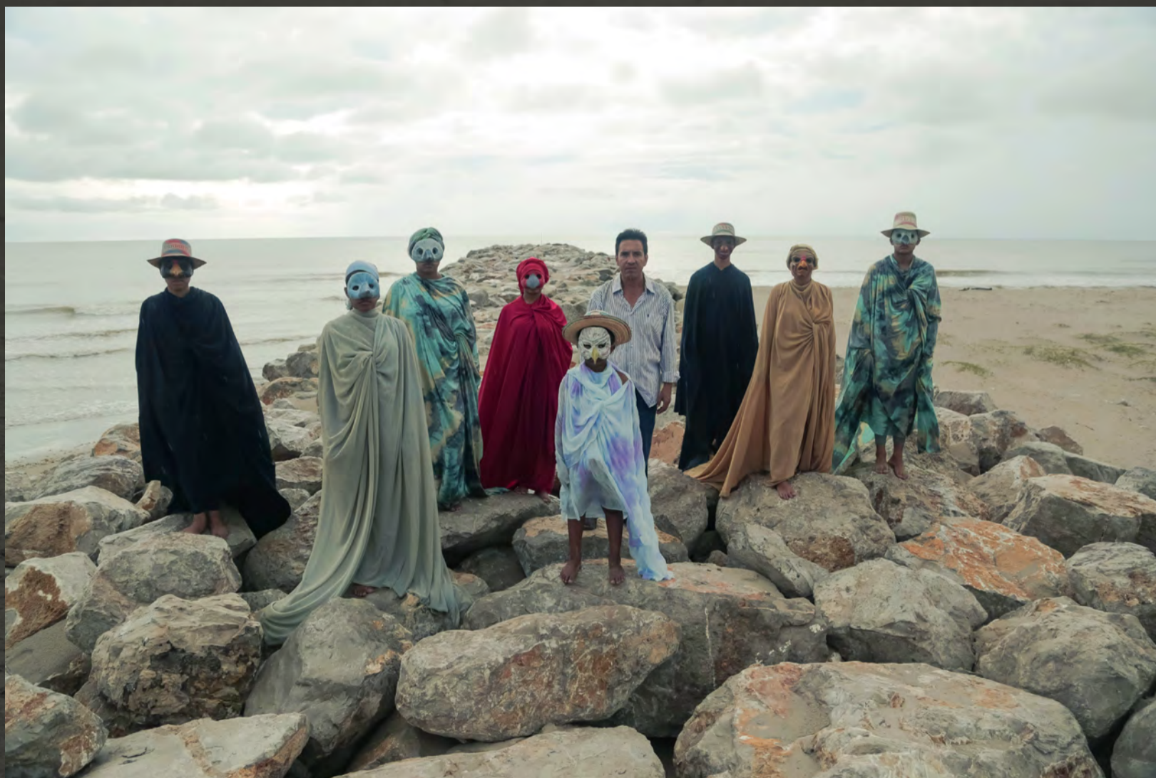
YONNA RITUAL WAYUU//Playa de Riohacha.// Duración: 1 hr, 2017// Crédito fotográfico: Juan David Padilla Vega