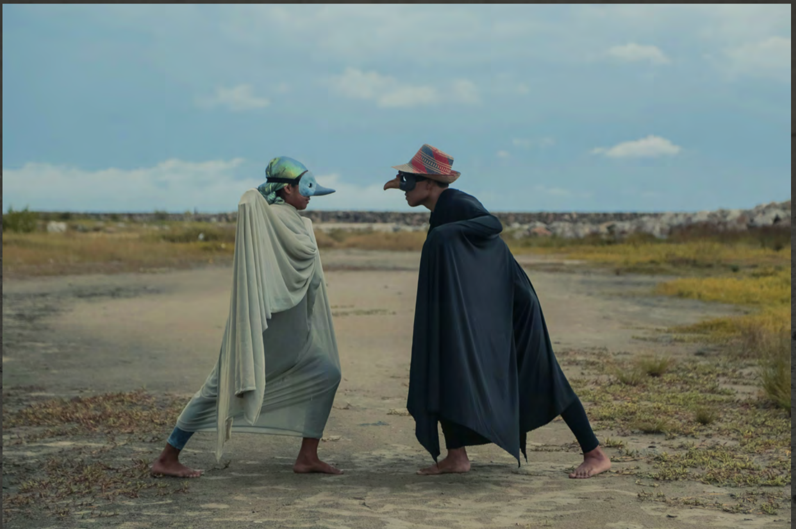
YONNA RITUAL WAYUU//Playa de Riohacha// Duración: 1 hr, 2017