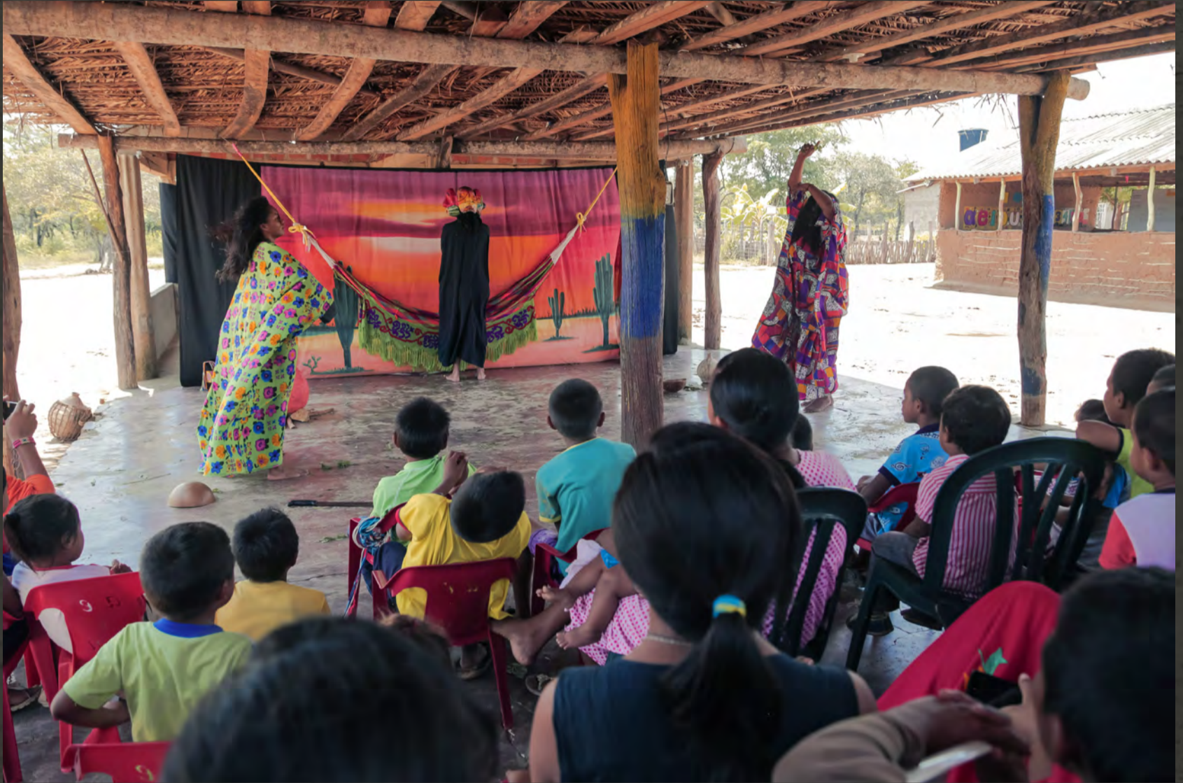
Los consejos de Serinuk//Rancheria Pesuapa Km 17 Vía a Maicao//Duración: 50 min, 2017//Crédito fotográfico: Juan David Padilla Vega