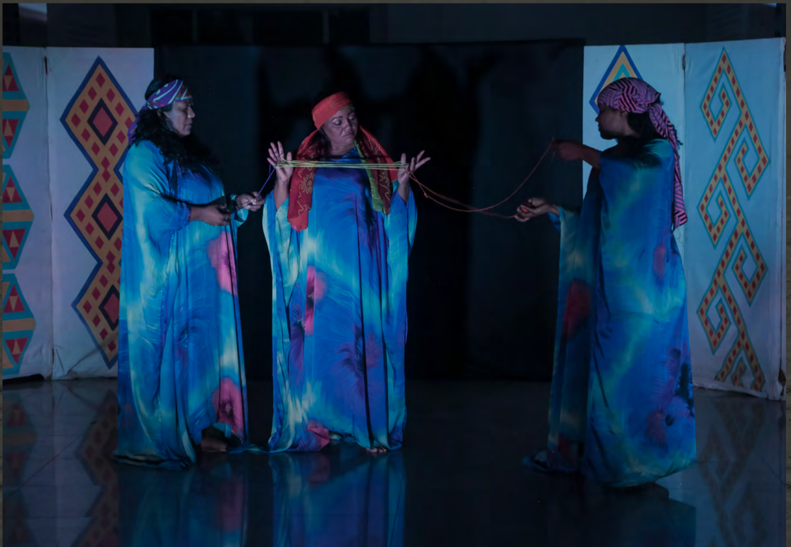
KATOU (ESTAR VIVO)//alón Sierra Nevada// (centro cultural de Riohacha) //Duración: 45 min, 2017 //