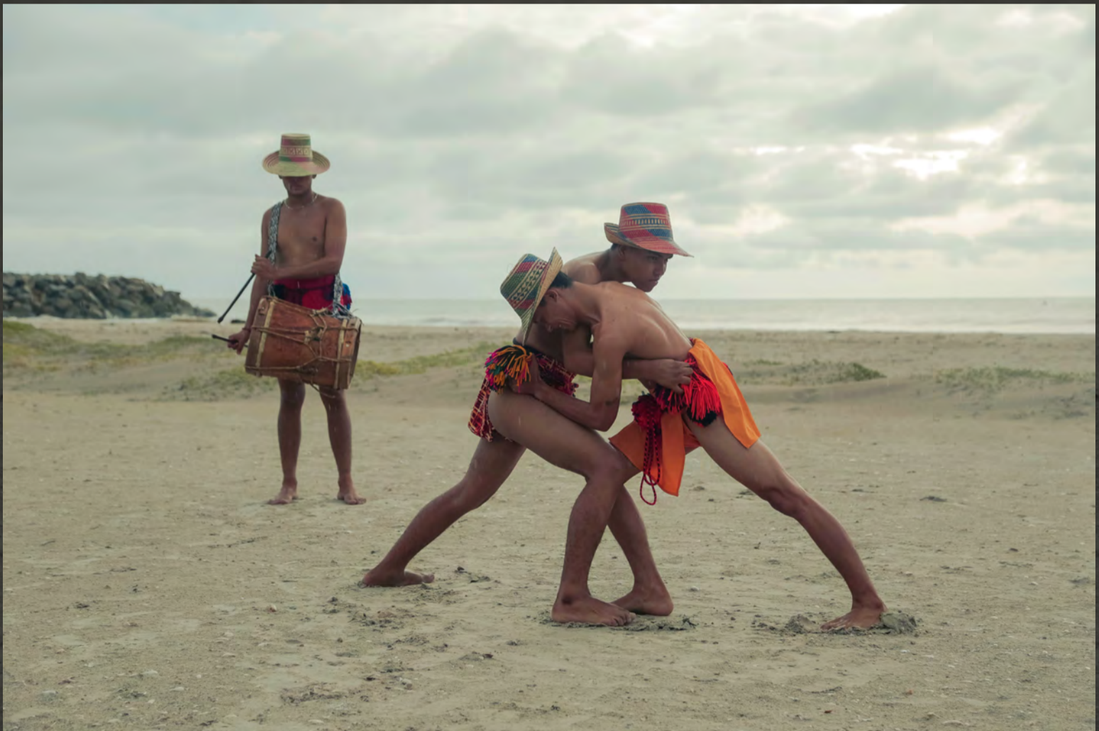
YONNA RITUAL WAYUU //Playa de Riohacha.// Duración: 1 hr, 2017