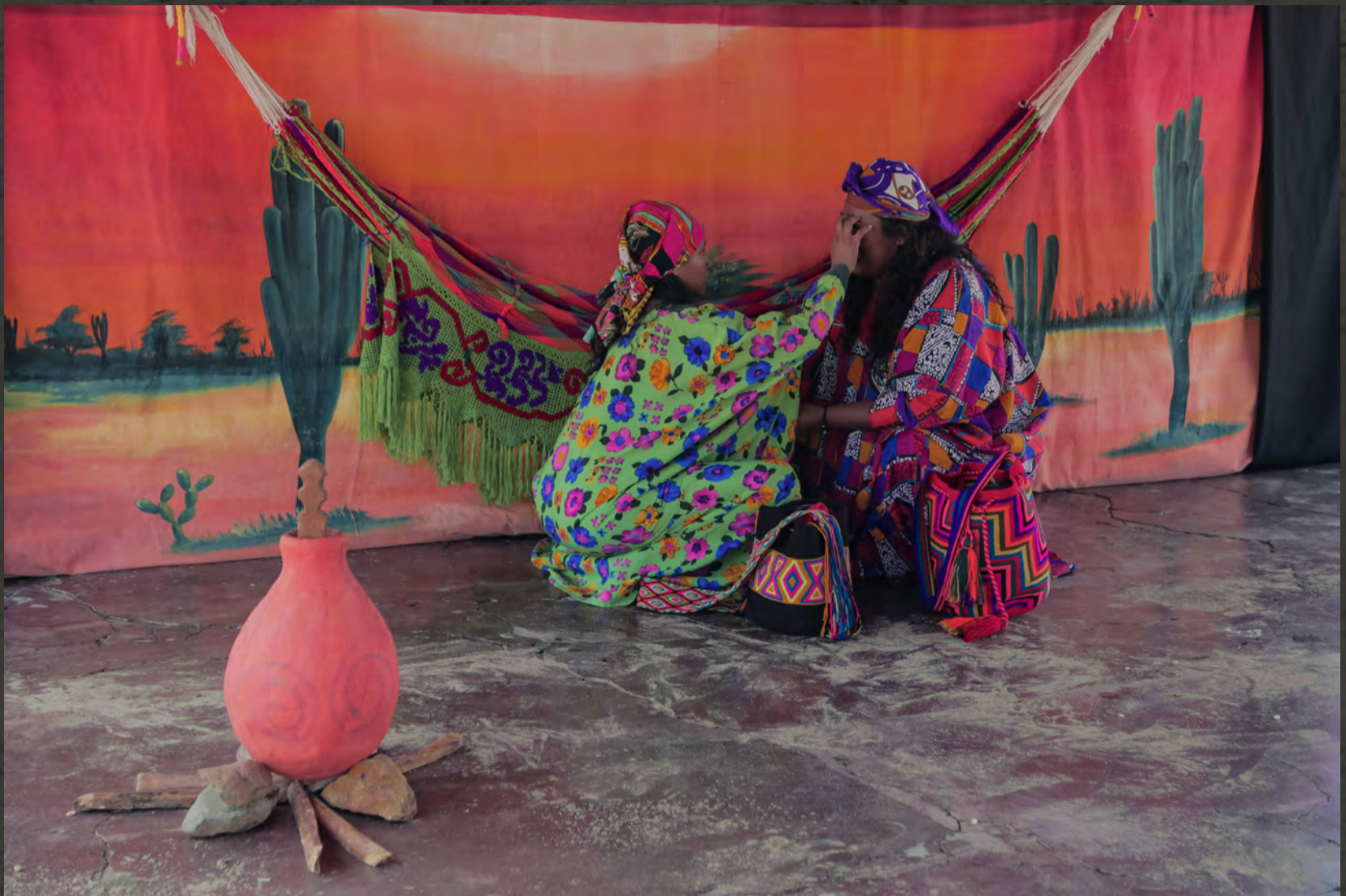
Los consejos de Serinuk//Rancheria Pesuapa Km 17 Vía a Maicao//Duración: 50 min, 2017//Crédito fotográfico: Juan David Padilla Vega