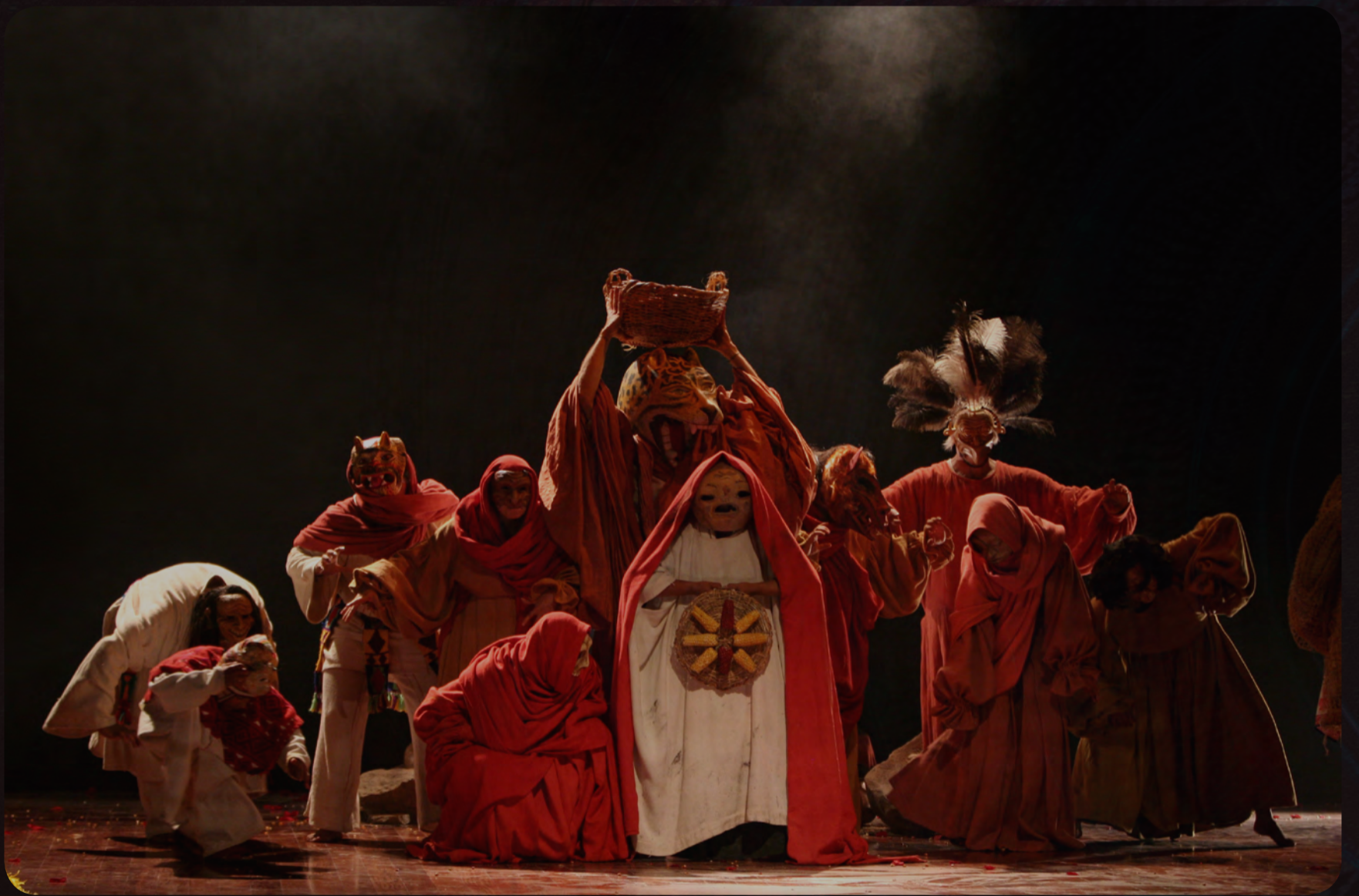
Sólo como de un sueño de pronto nos levantamos // Teatro itinerante del sol // Duración: 1 hr, 2008 // Crédito fotográfico: Beatriz Camargo