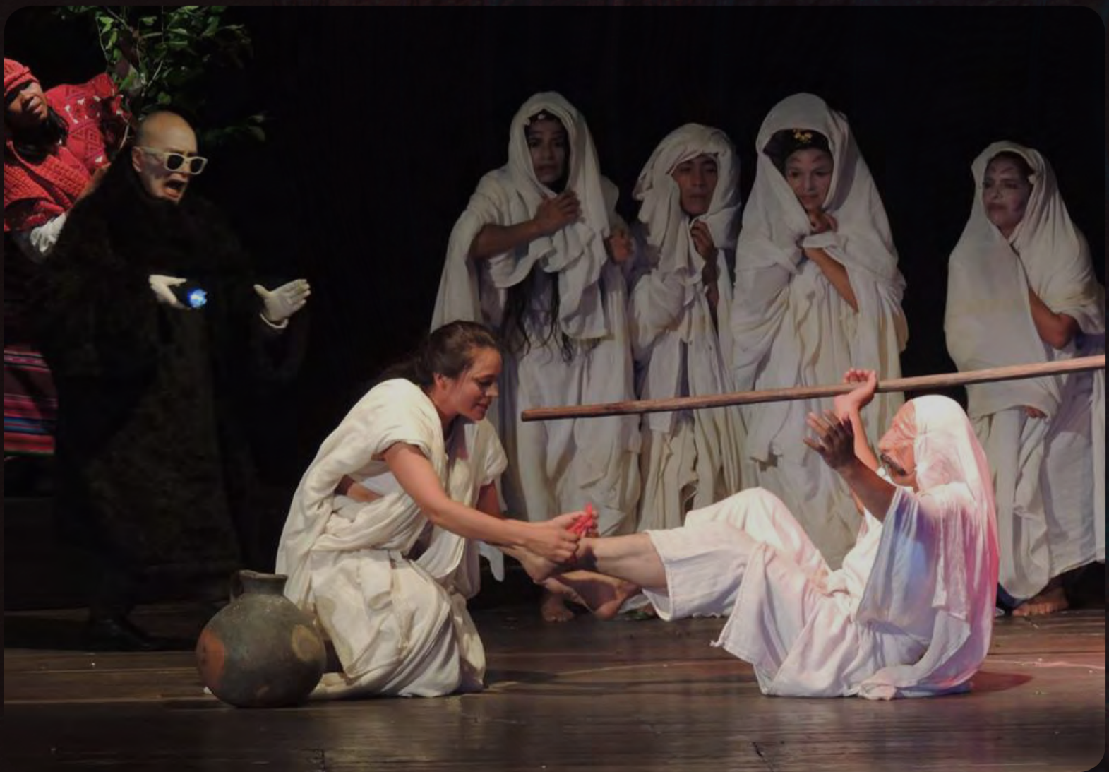
Orígenes // Teatro itinerante del sol //Teatro Jorge Eliecer Gaitán // Duración: 1 hr 15 min, 2015