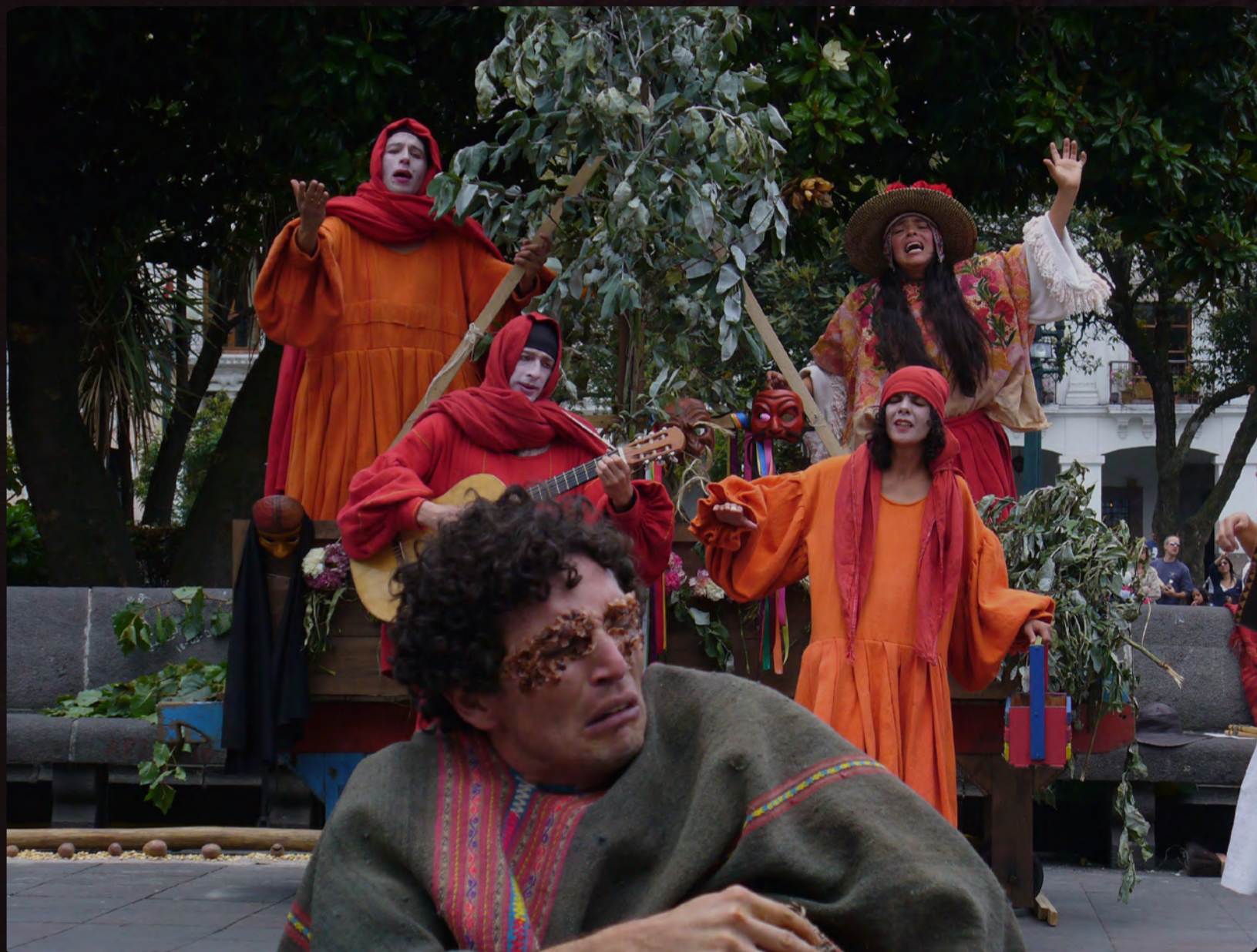
La Flor de Amate Cún//Plaza de la Independencia-Quito//Duración: 50 min, 2004//Crédito fotográfico: Beatriz Camargo