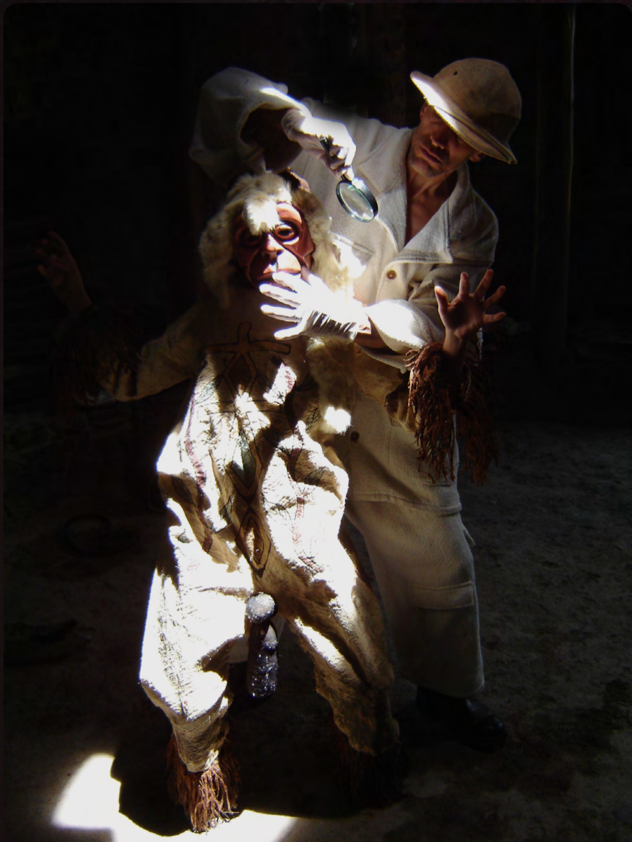
Enigma // Teatro itinerante del sol // Duración: 1 hr 20 min, 2001