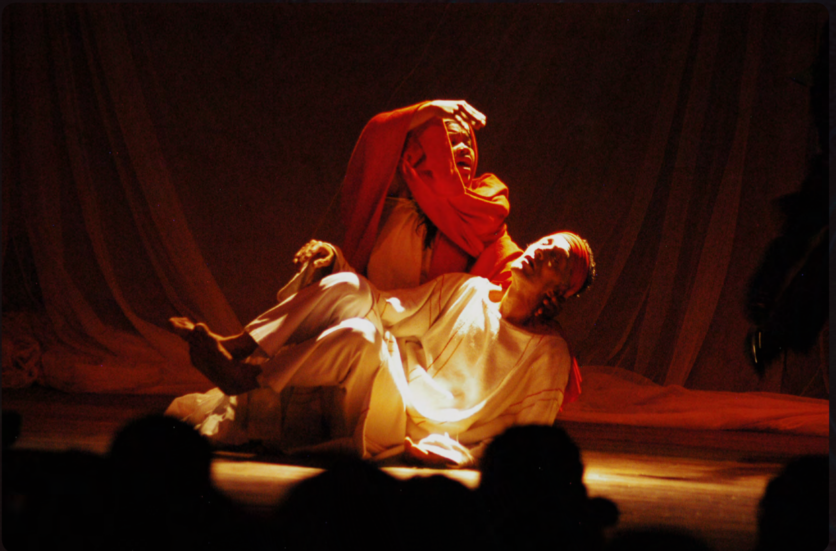
La Flor de Amate Cún//Plaza de la Independencia-Quito//Duración: 50 min, 2004//Crédito fotográfico: Beatriz Camargo