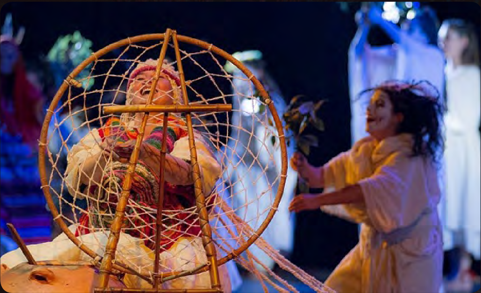
Orígenes // Teatro itinerante del sol // Teatro Jorge Eliecer Gaitán Duración: 1 hr 15 min, 2015