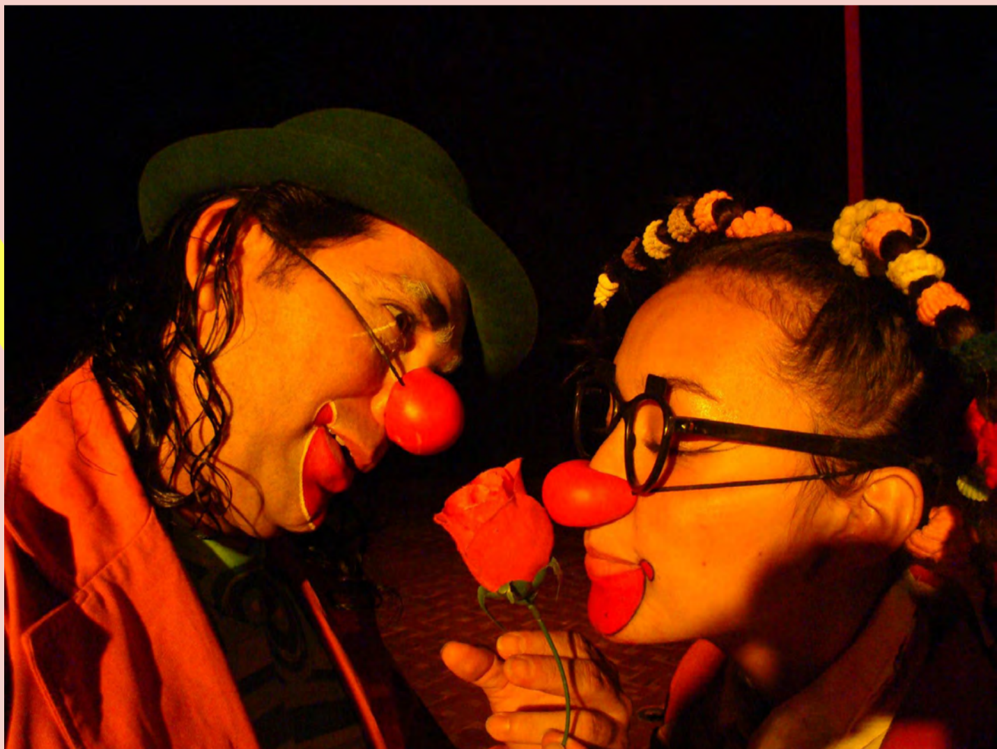
De Amor y Locra/ Incubaxion Teatro//Sede principal Incubaxion Teatro. Duración: 1 hr, 2009