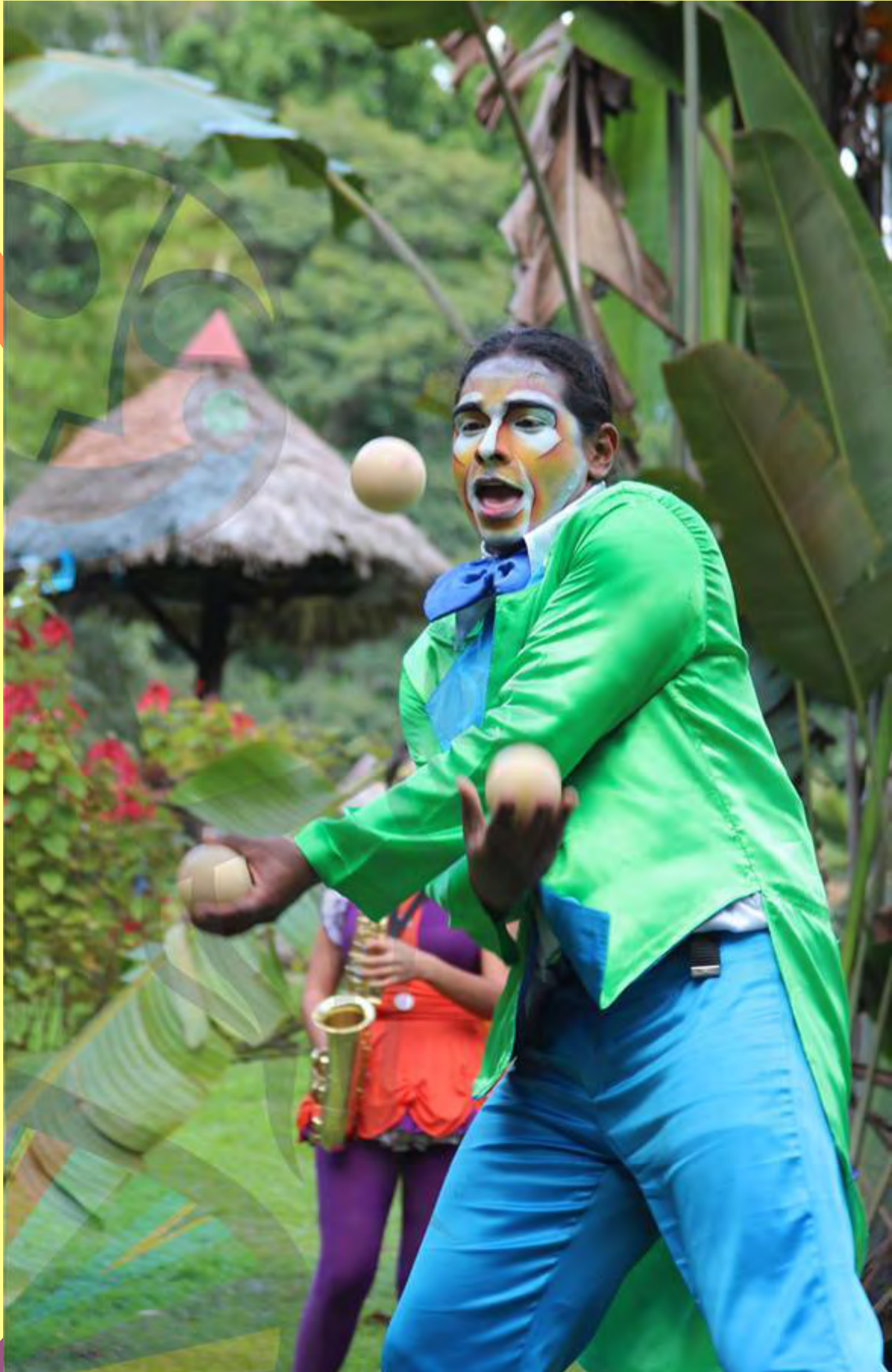
Parada en zancos/Giron Santander./ Duración: 1 hr, 2013