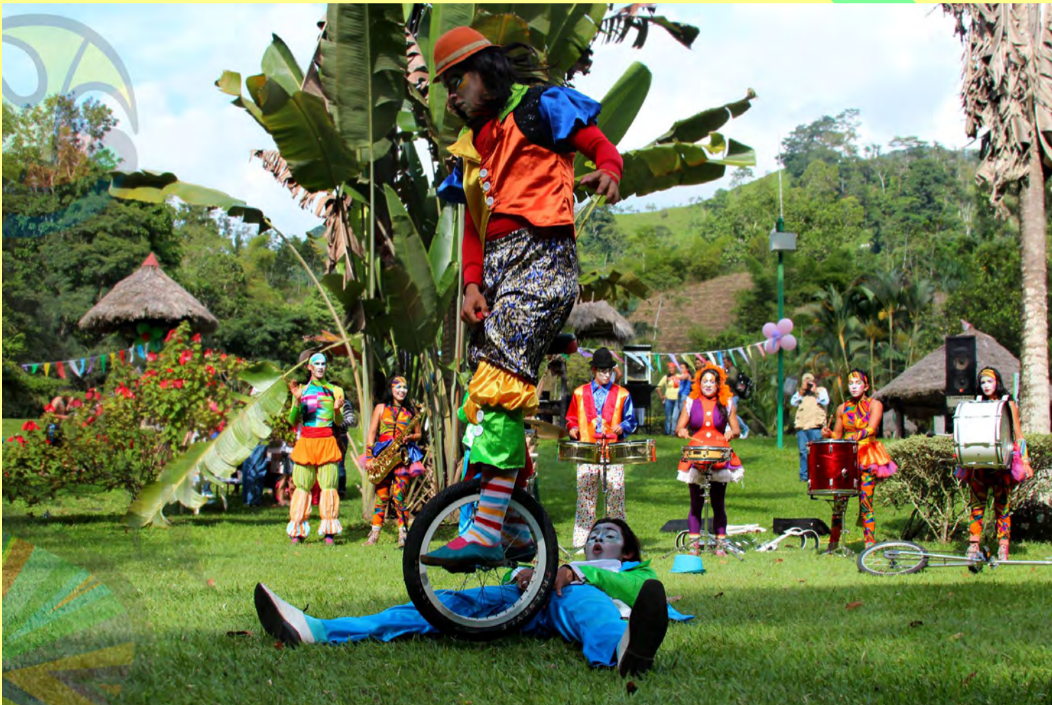
Parada en zancos//Girón Santander.// Duración: 1 hr, 2013