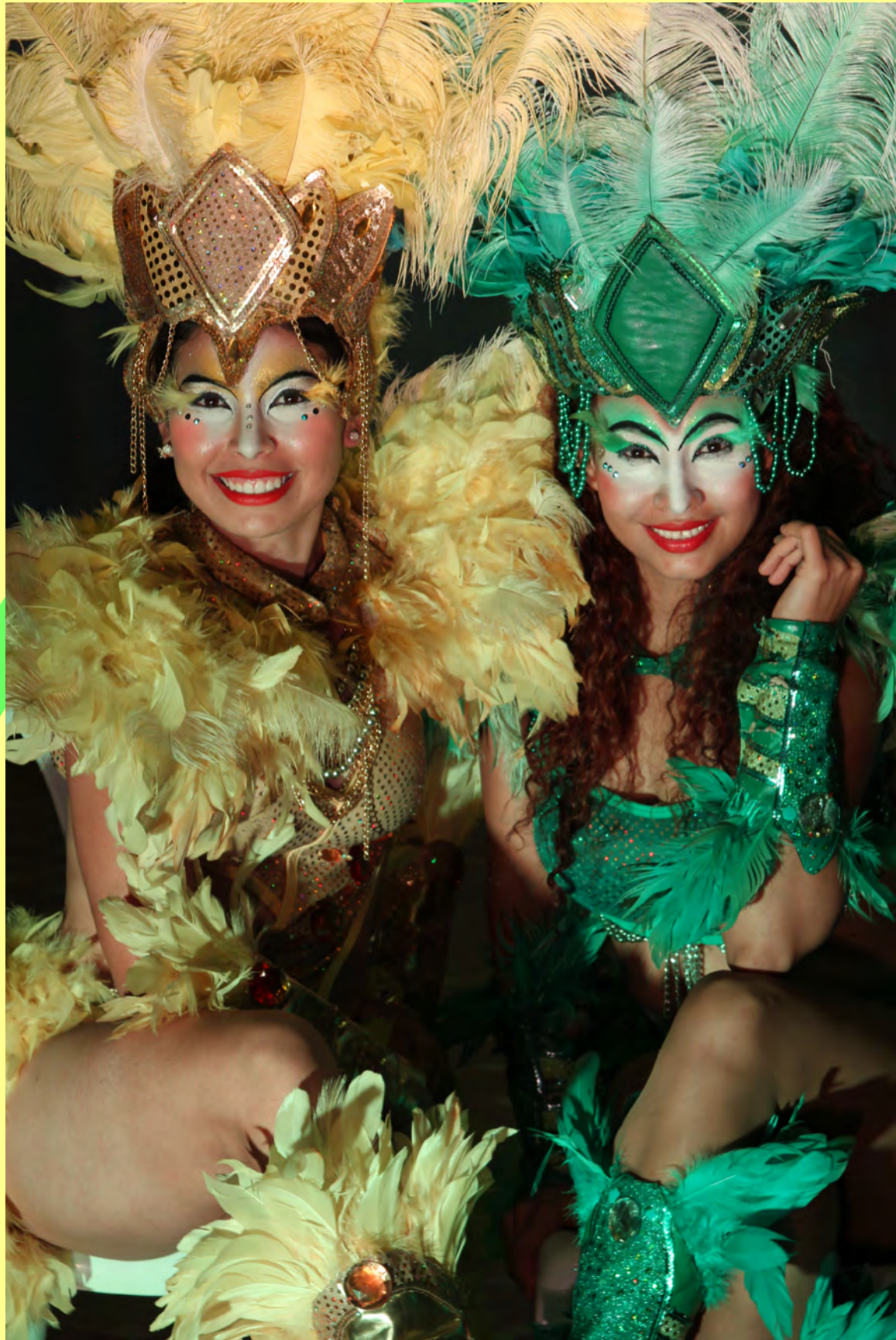
Carnaval de Janeiro//Girón Santander.// Duración: 1 hr, 2017