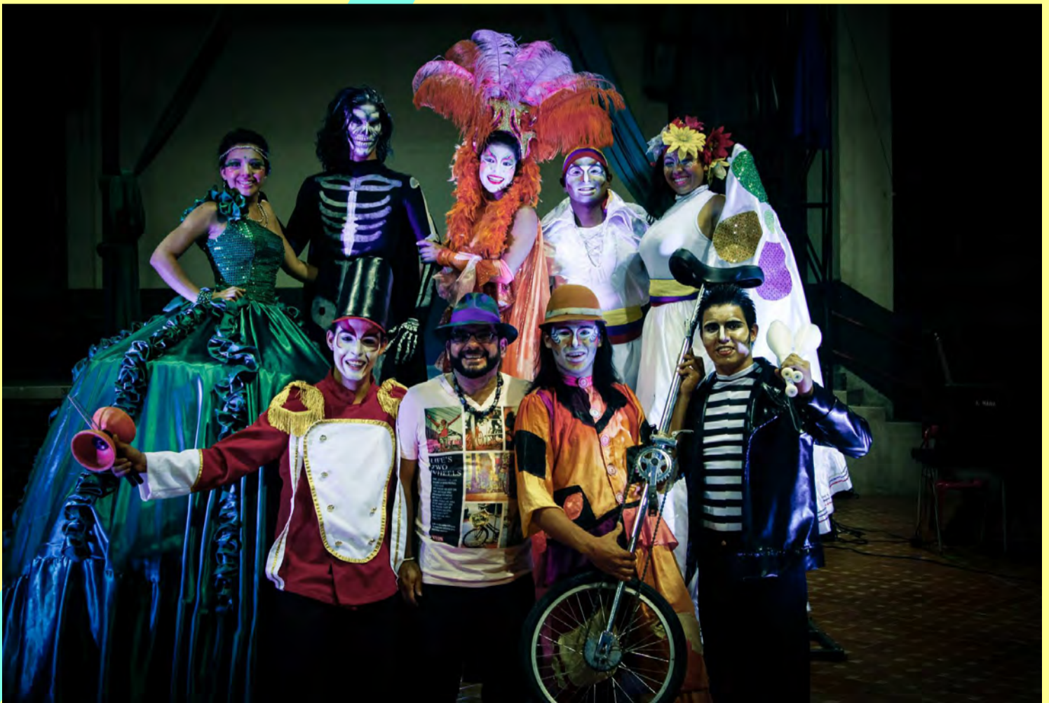
Personajes//Sede principal INCUBAXION TEATRO, //2013