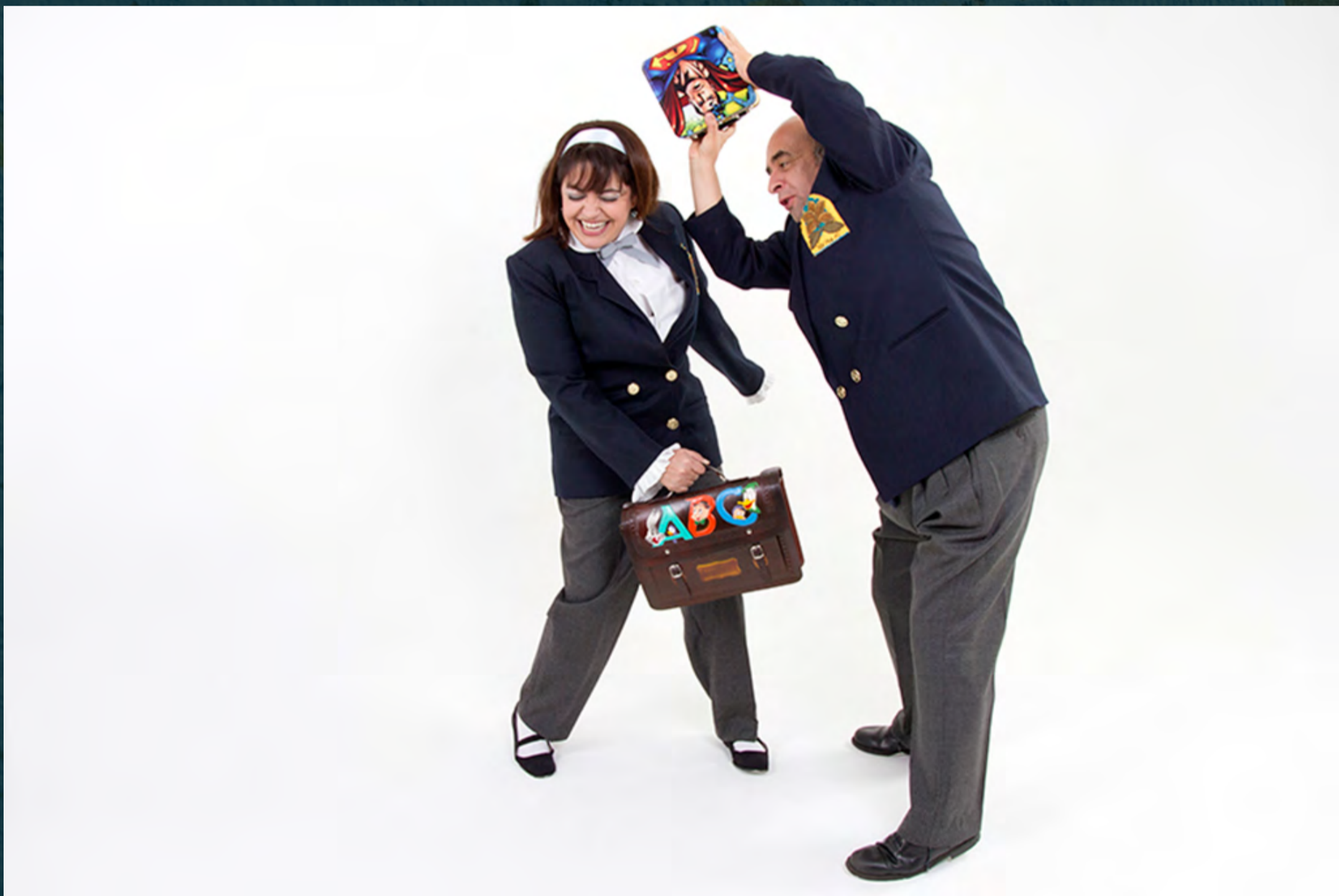
Güerfanitos / Teatro Nacional Fanny Mickey / Duración: 1 hr, 2014 / Crédito fotográfico: Julian Arango