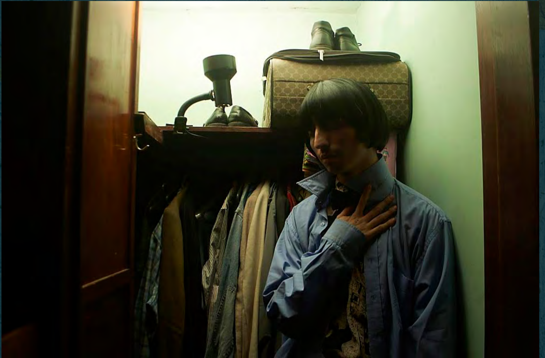
Apesta / Exilia2, 2016.