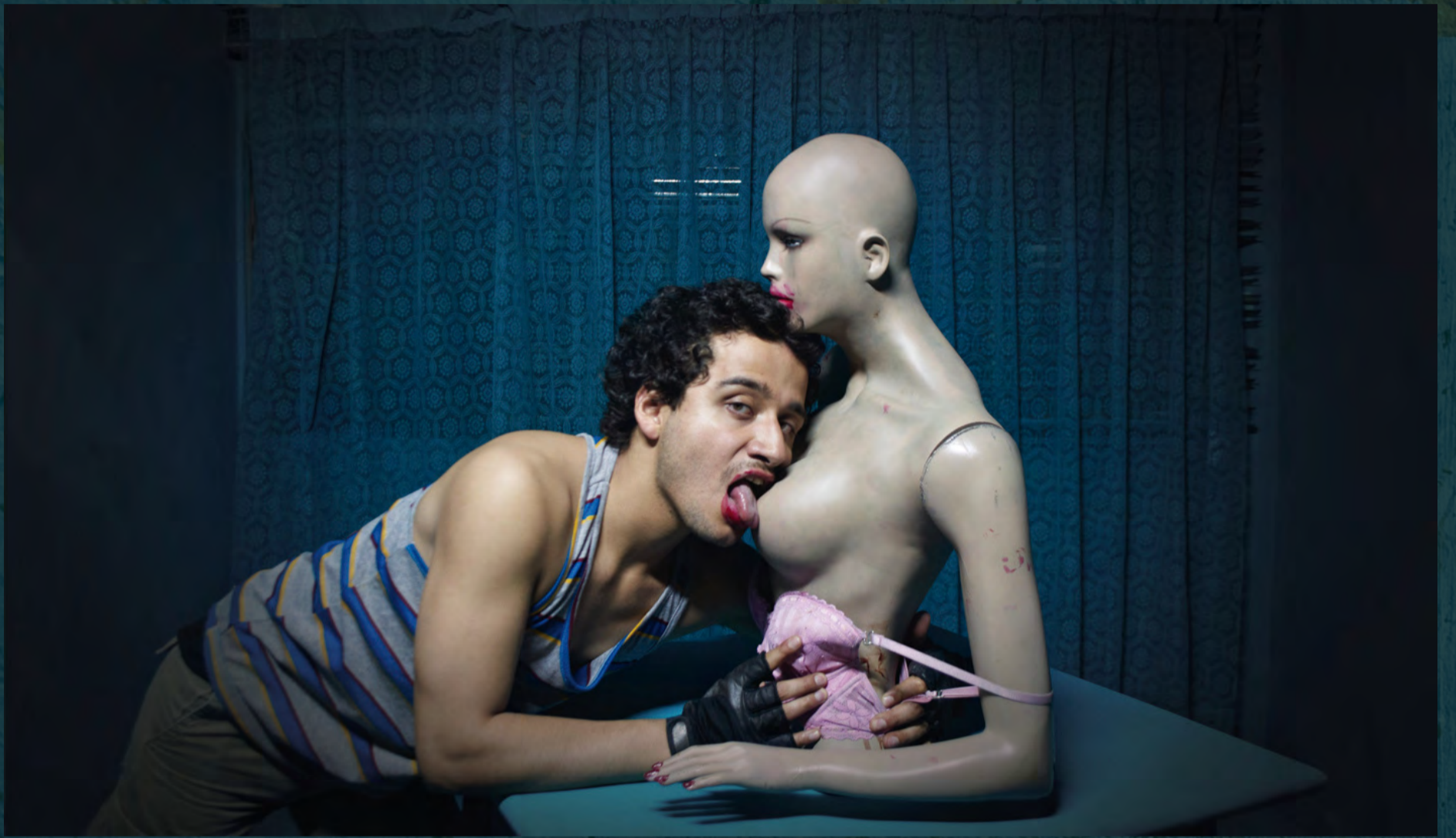
Apesta / Exilia2, 2016.