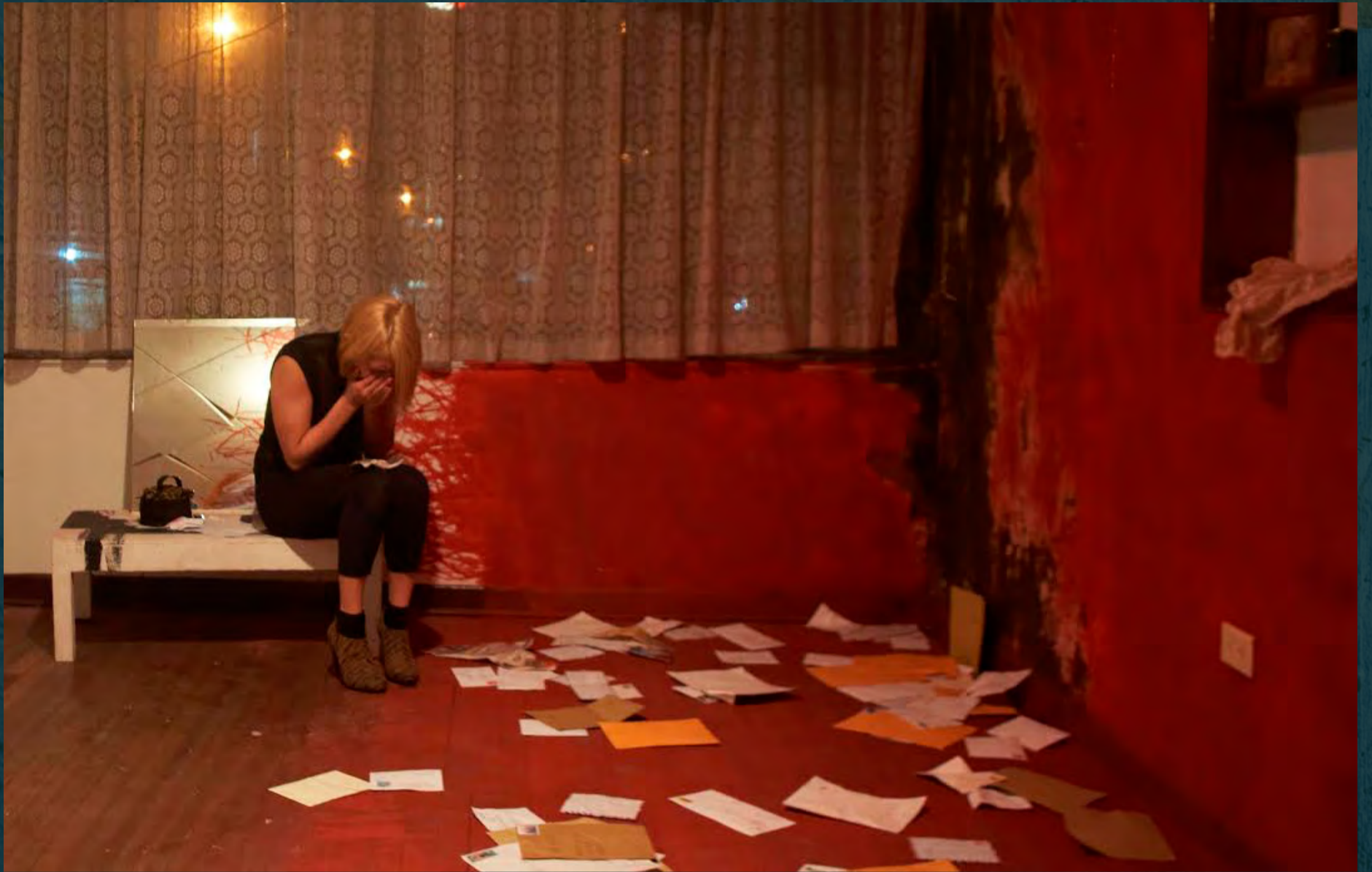
Apesta / Exilia2, 2016.