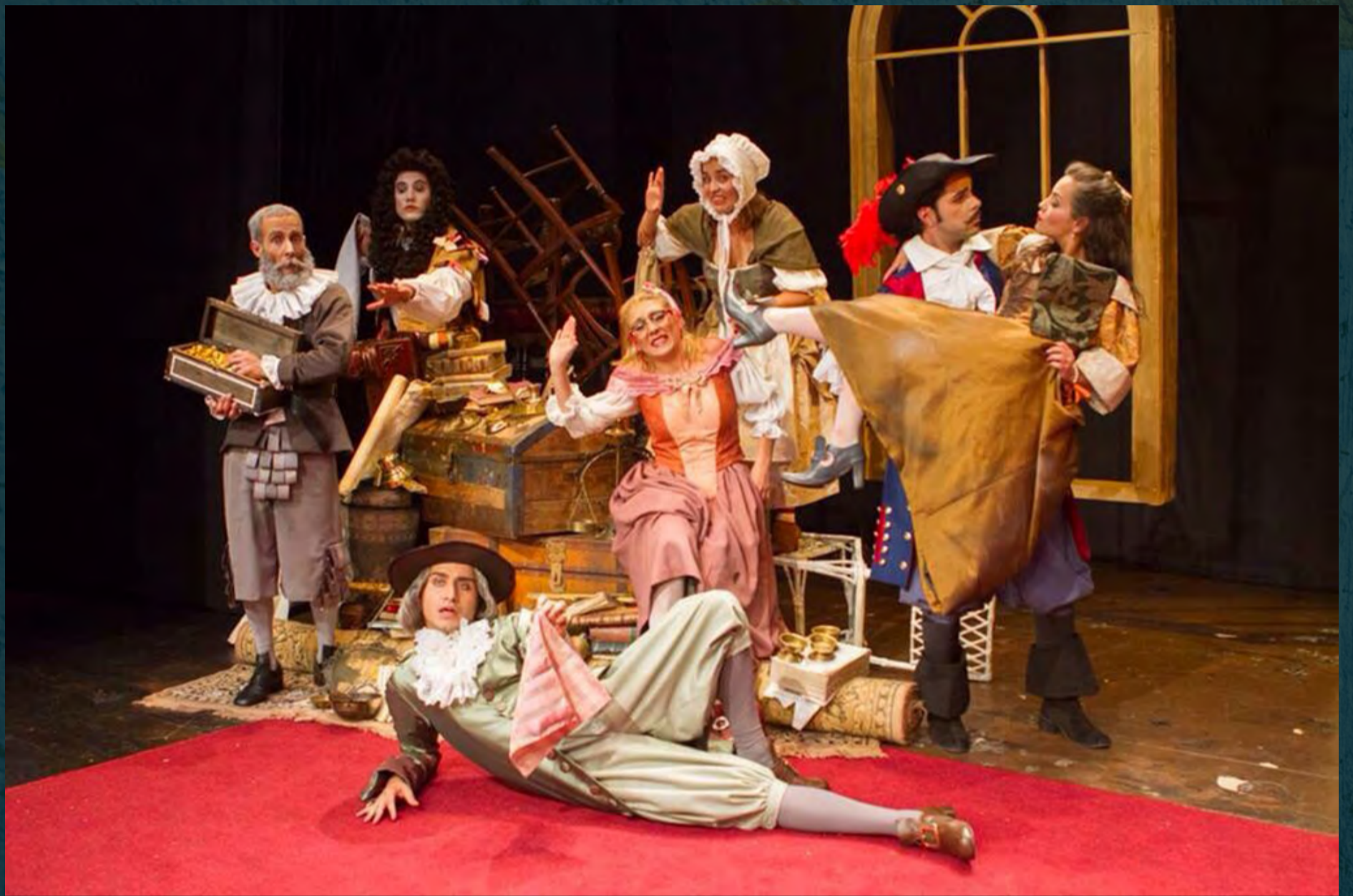
El Avaro / Teatro Nacional la Castellana / Duración: 70 min, 2015