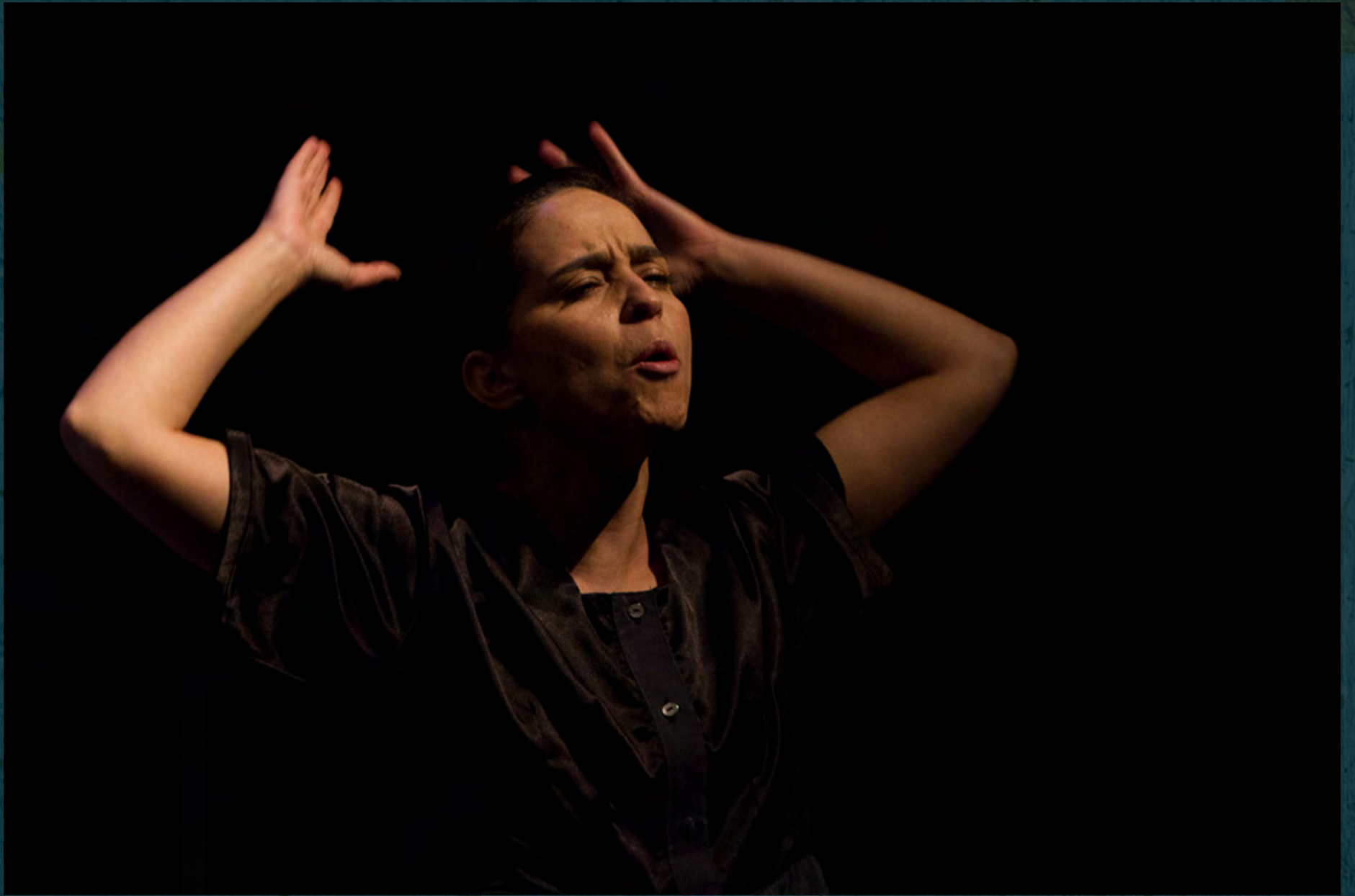
Voz / Exilia2, Casa del Teatro Nacional /Duración: 80 min, 2014 / Crédito fotográfico: Julián Arango