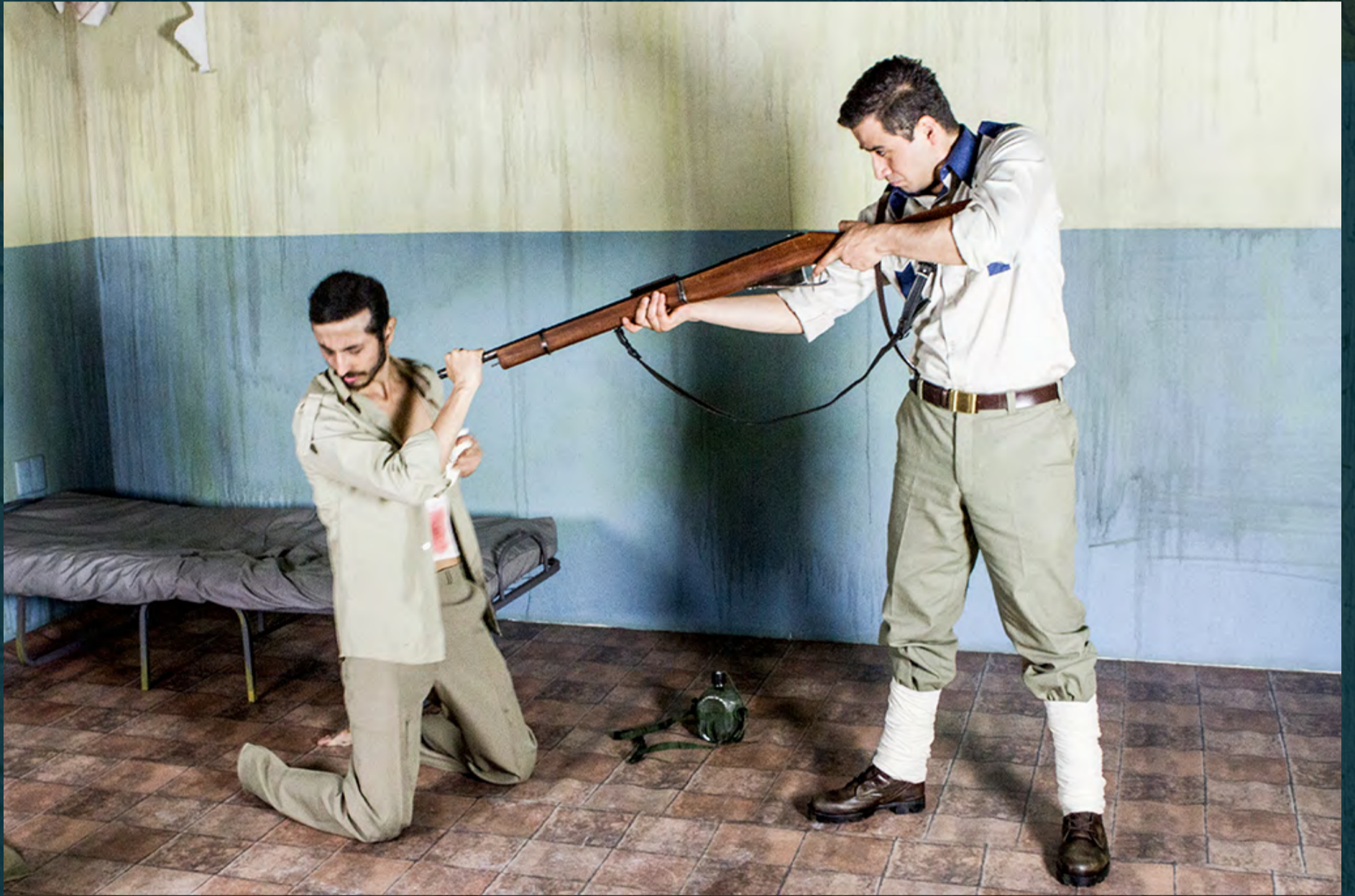
La Piedra Oscura / Sala Uno / Duración: 65 min, 2016