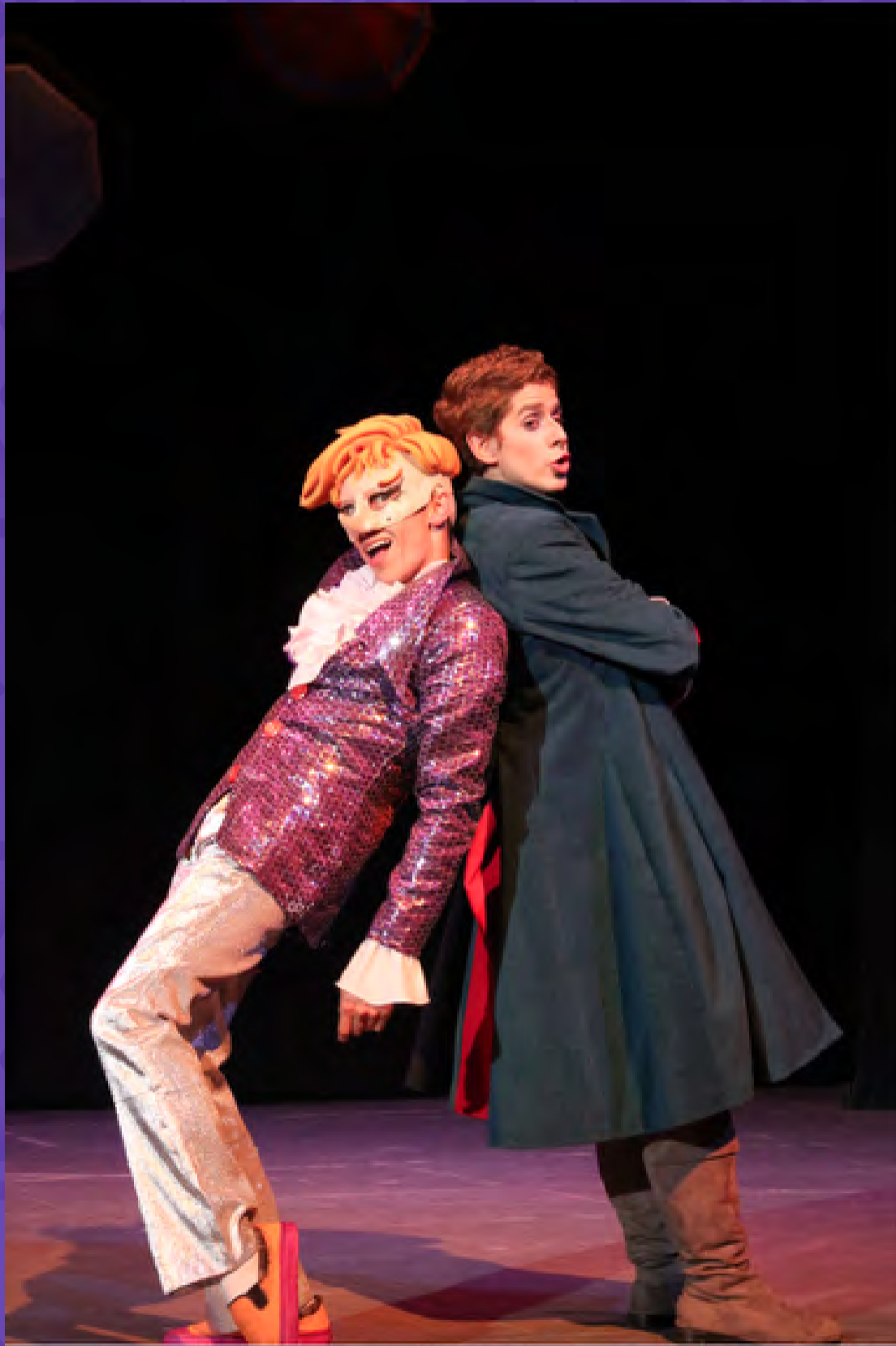
El Principito / Teatro Jorge Ekiecer Gaitán, 2015 / Crédito fotográfico: Carlos Lema