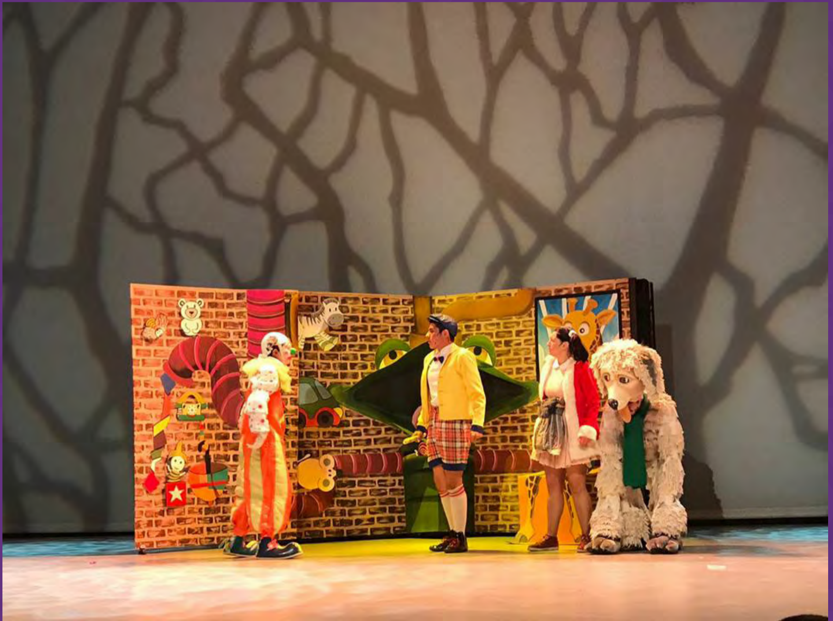
Rabito y El hada de cristal/ Teatro Cafam de Bellas Artes, 2017