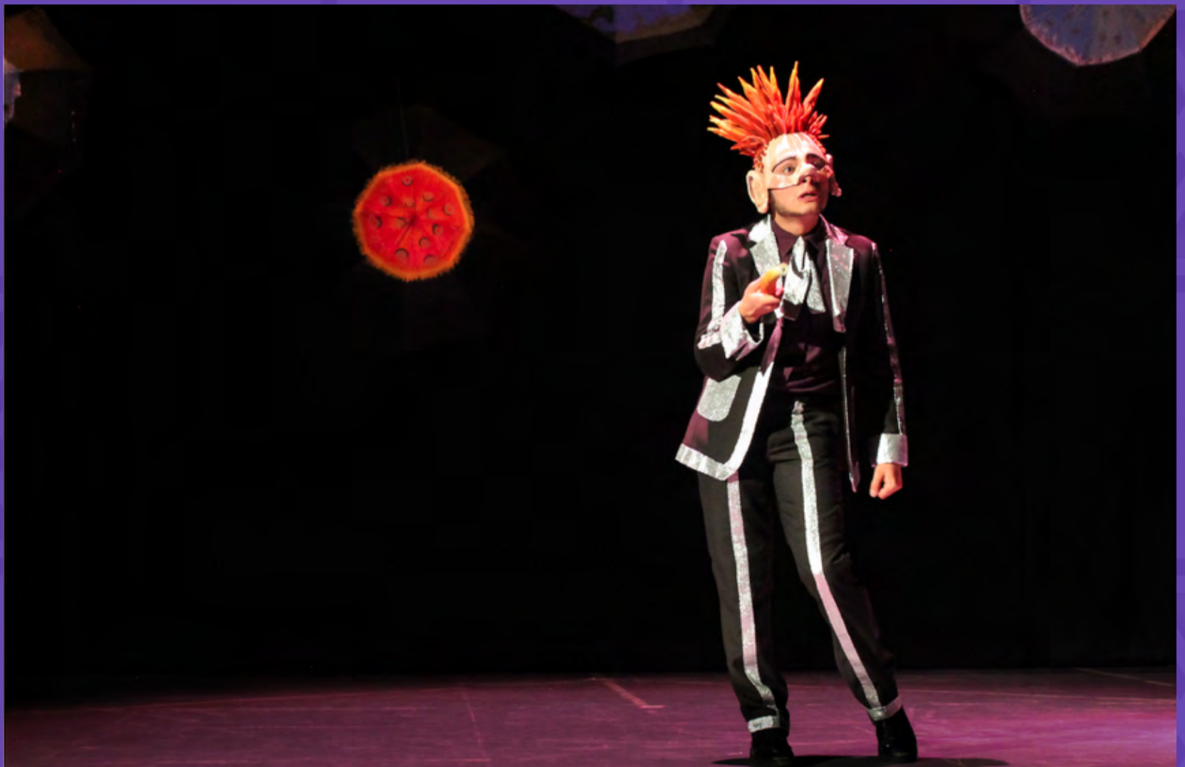
El Principito / Tetatro Jorge Ekiecer Gaitán, 2015