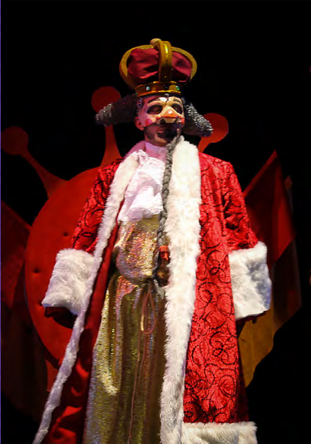
El Principito / Tetatro Jorge Ekiecer Gaitán,2015