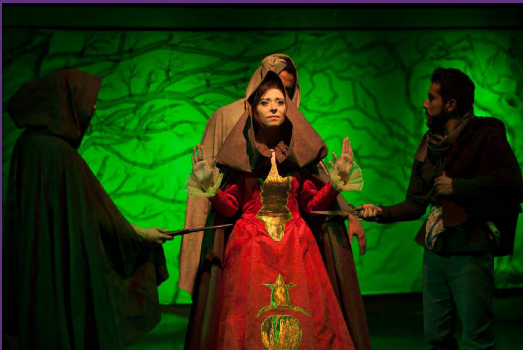
Los dos Hidalgos de Verona/ Academia Charlottl,2016