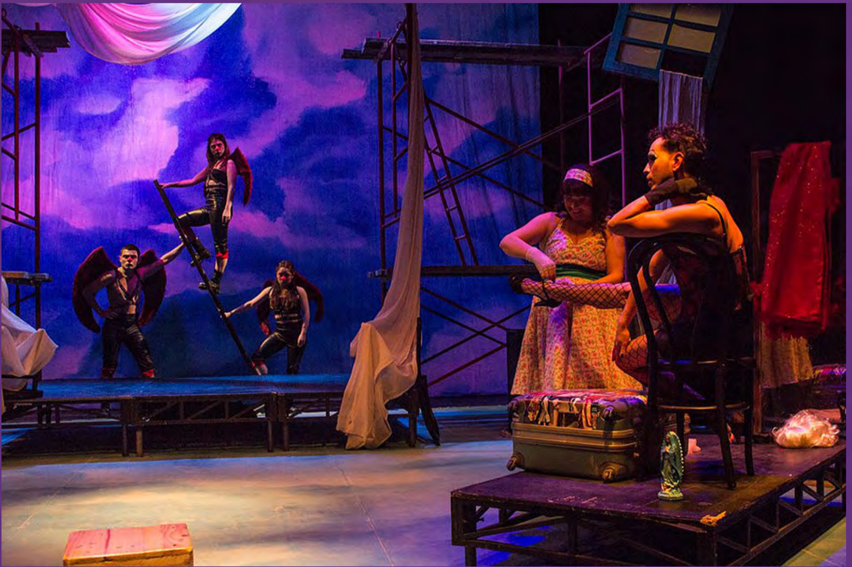
Pequeños crímenes de familia la madre/ Casa del Teatro Nacional,2017/ Crédito fotográfico: Maria Camila Salamanca