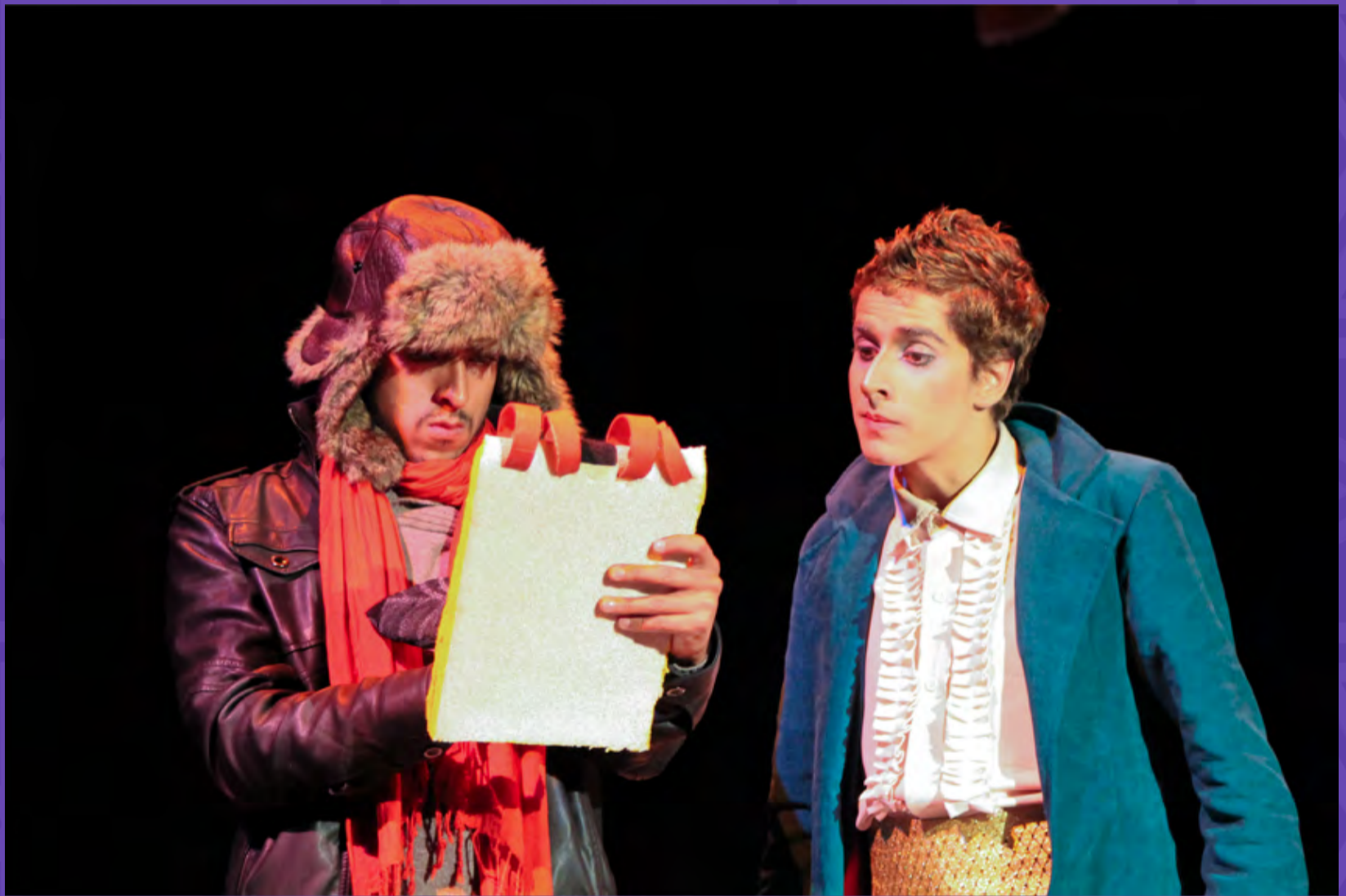
El Principito / Tetatro Jorge Ekiecer Gaitán,2015